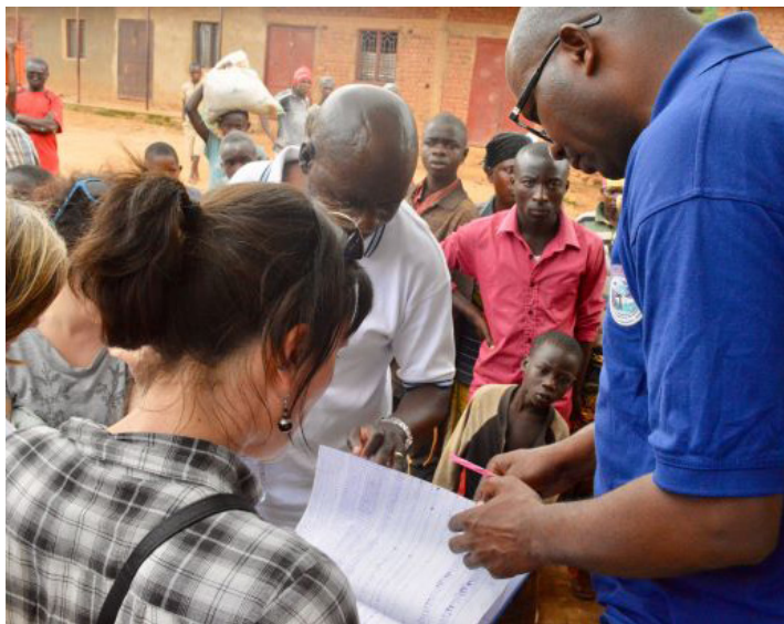
En février 2020, les acteurs de la coopération belge et internationale ont visité des projets autour de l'eau en vue du développement d'une stratégie de l'eau pour la DGD.

C'est dans ce cadre qu'est né le programme Water Nexus afin de soutenir la Coopération belge dans sa réflexion et prise de décision dans sa stratégie « Eau ».